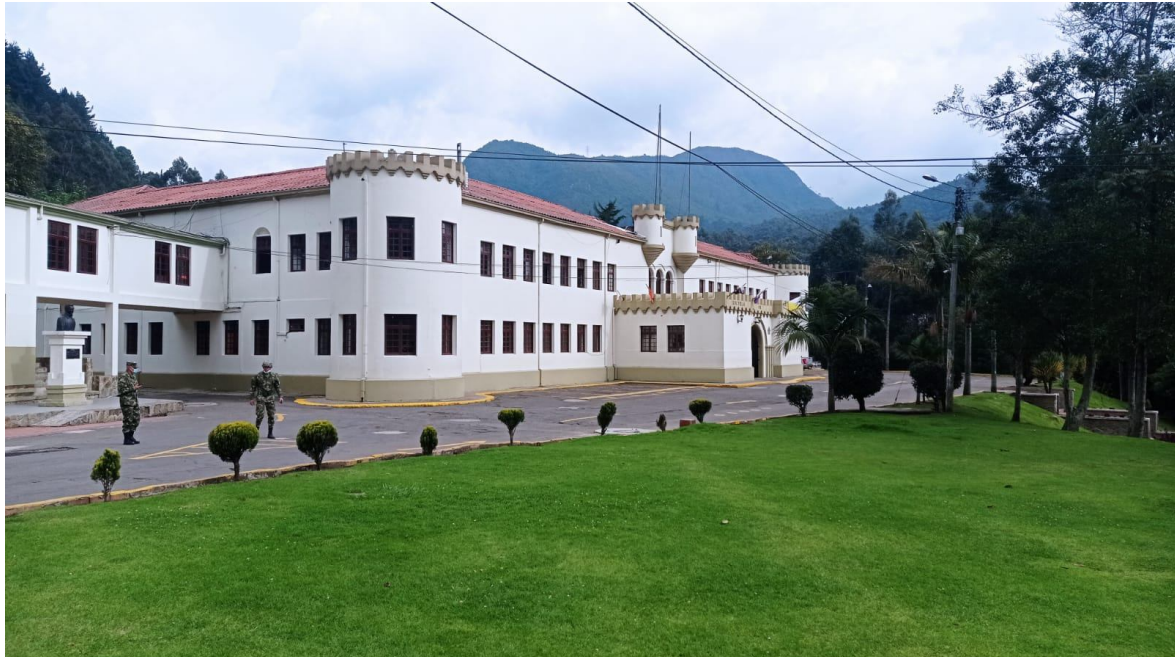
Fig.7. La edificación estado actual.

La Administración local (2020-2023), dentro del marco de la campaña que viene adelantando, “San Cristóbal tiene Memoria”, está reconociendo los Bienes de Interés Cultural ubicados dentro de la localidad Cuarta de San Cristóbal, para contribuir al fortalecimiento y la construcción de nuestras propias memorias, ha logrado conjuntamente con la Secretaria de Cultura Recreación y Deportes y el Consejo Distrital de Patrimonio con el Instituto Distrital de Patrimonio Cultural, declararan el inmueble que funciono como Hospital Militar entre 1937 y 1962, como Bien de Interés Cultural como “ un legado histórico más que aporta la localidad de San Cristóbal a la ciudad. ”