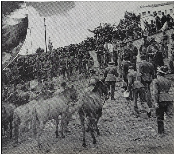
Fig.6 Fiesta del Pan del Soldado en el Antiguo Hospital Militar.