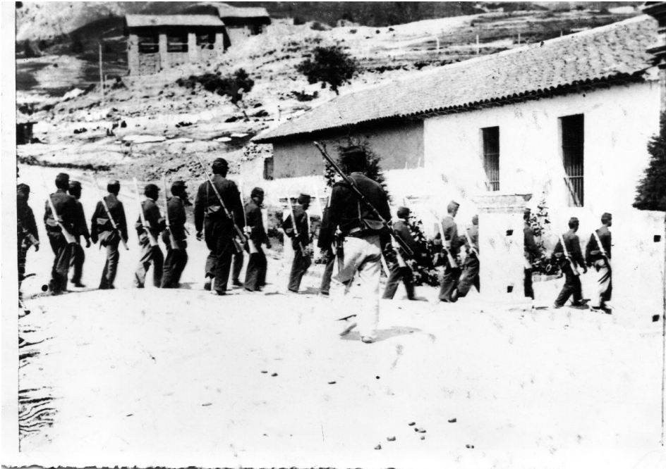
Fig.5. El Aserrio: Quedaba ubicado en la carrera 6 algunas cuadras al sur de la Plaza de Las Cruces al principiar la cuesta del camino a San Cristóbal. En la misma casa en donde quedaba el Aserrio, tuvo su asiento durante la última guerra civil, uno de los cuarteles del General Fernández. 1899. Esta edificación fue demolida y en el mismo lugar funciona hoy una sede del Instituto Colombiano de Bienestar Familiar del barrio Villa Javier.

Dicho sea de paso, podemos decir que el edificio es un caso de una edificación ecléctica de dos pisos, amplia, moderna e iluminada, que presentó una modificación en las ventanas del segundo piso que en el plano original eran rectángulos verticales reemplazadas por ventanas rematadas en arco de medio punto, es una construcción simétrica, muy particular, que fue realizada simulando elementos de un castillo con dos torreones y un dentado que recuerda las almenas de los baluartes militares, seguramente por su inicial función de “Cuartel de Santa Ana” en predios de la Fábrica de Municiones del Ejército Nacional.