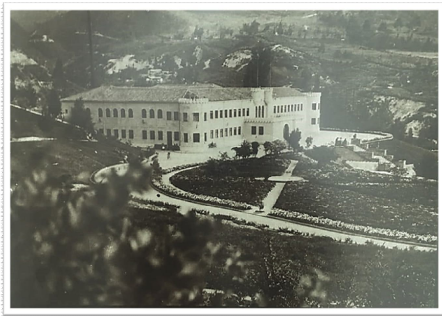
Fig.1 Hospital Militar, 1939: Fuente: Museo Colsubsidio

La edificación fue inicialmente concebida como el Cuartel de Santa Ana, por estar ubicado cerca a la Quinta de Santa Ana, lugar histórico del Almacén de Pólvora Real, hoy está en predios de la Fábrica de Municiones; es una obra atribuida desde septiembre de 1935, según planos originales firmados y dibujados a tinta sobre papel tela, que reposan en el Archivo General de la Nación, al arquitecto Carlos Rodríguez Moreno.