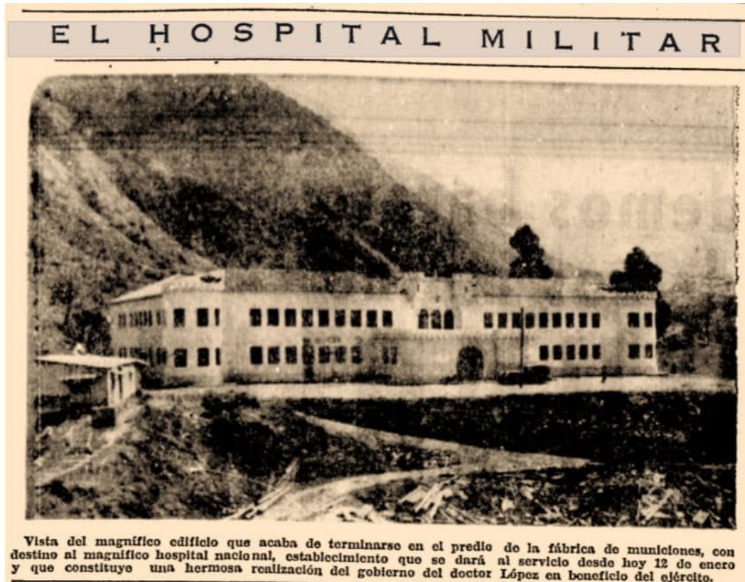
Fig.4 Hospital Militar en culminación de sus obras. Nótese el campamento de obra y la crudeza de las obras exteriores.

A los 87 años de su finalización, es considerado un Bien de Interés Cultural para la ciudad, un auténtico ejemplo de patrimonio militar construido que alberga valores arquitectónicos, históricos, paisajísticos y simbólicos, entre otros.